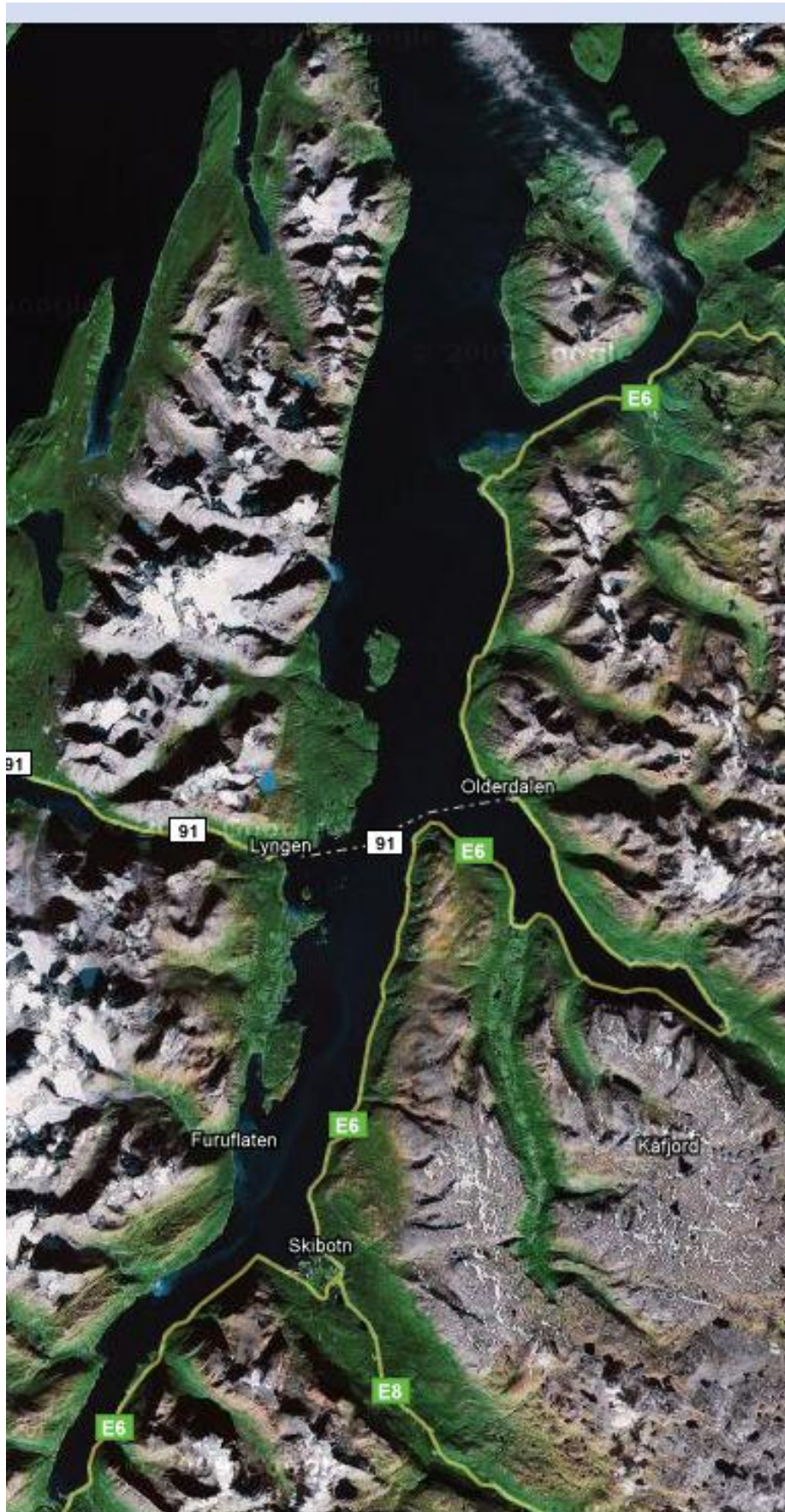
Bilde av I Lyngenfjorden